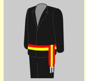
Echevins, Président CPAS